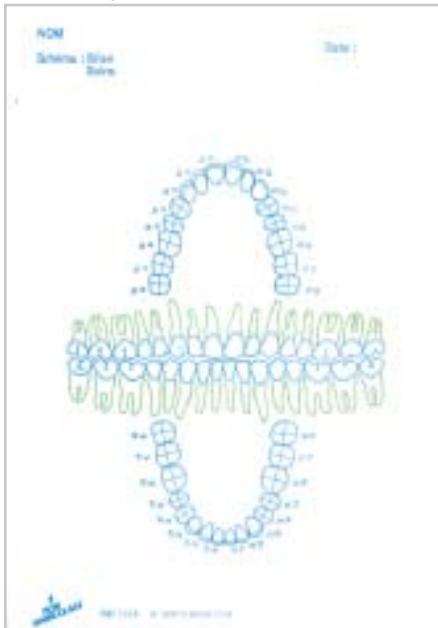
Dim : H 200 x L 140 mm