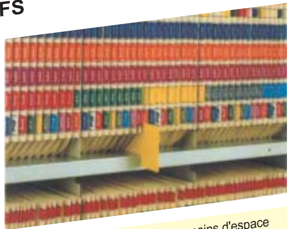
Classez plus de dossiers dans moins d'espace

PCM HABILCLASS vous propose des dossiers posés dont l'épaisseur varie strictement avec celle des documents qu'ils contiennent. Vous obtenez ainsi une optimisation de l'espace qui atteint couramment 30% de gain de volume et parfois davantage. De plus, vos dossiers étant bien classés et facilement identifiables, l'épuration des dossiers qui ne sont plus actifs se fait d'autant plus rapidement, libérant dans les meilleurs délais de l'espace pour les nouveaux dossiers.