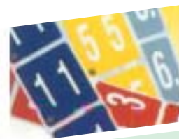
Les étiquettes numériques