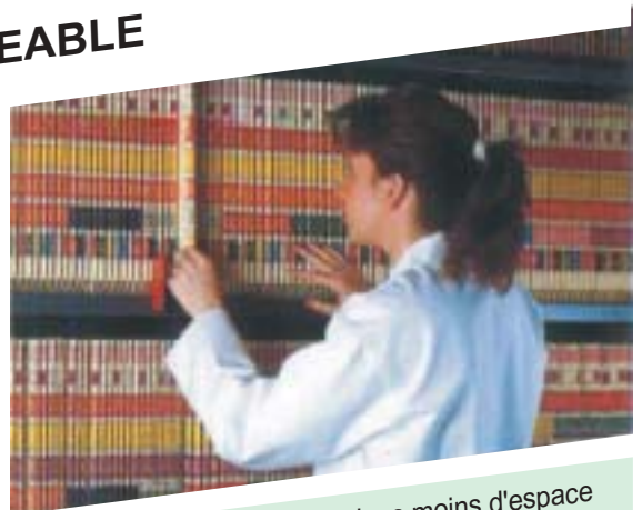
Classez plus de dossiers dans moins d'espace

Faites le choix d'un système souple et évolutif : Les systèmes PCM HABILCLASS s'appliquent en structures centralisées ou pavillonnaires, aussi bien dans les cas d'archivage central que d'archivage par service. Parce qu'un système de classement fiable doit suivre l'évolution de ses utilisateurs, les systèmes numériques PCM HABILCLASS sont à croissance illimitée et ne remettent jamais en cause la numérotation des dossiers existants.