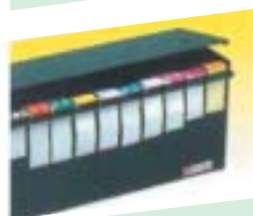
Le magasin distributeur