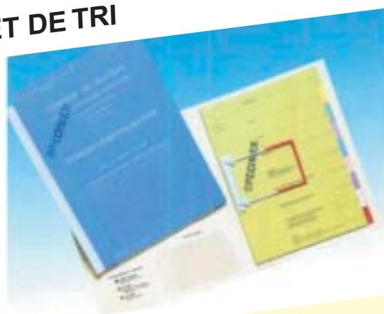
Des solutions personnalisées

La consultation aisée et rapide du dossier médical durant l'hospitalisation nécessite la mise en ordre des documents qu'il contient. Le tri ultérieur en est ainsi facilité pour la conservation ou le microfilmage éventuel des seuls éléments présentant un intérêt à terme. A cet effet nous vous proposons d'étudier avec vous des solutions adaptées aux exigences du corps médical.