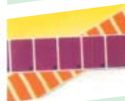
Les étiquettes de signalisation