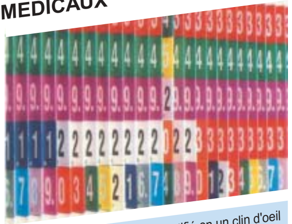
Tout dossier mal classé est identifié en un clin d'oeil

Grâce à son système de signalisation couleur, PCM HABILCLASS vous permet de retrouver un dossier en moins de 20 secondes et de le reclasser sans risque d'erreur : à chaque chiffre correspond une couleur, à chaque numéro correspond un ensemble unique de couleurs; ainsi tout dossier mal classé se dénonce de lui-même comme le montre notre illustration. Votre classement se fait en toute sécurité et sans perte de temps.