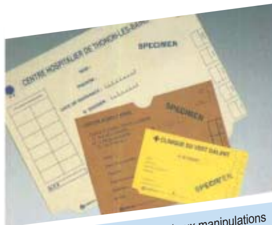
Des dossiers solides qui résistent aux manipulations

Pour toutes dimensions, options ou tout matériau hors standard (PVC par exemple), n'hésitez pas à nous interroger.