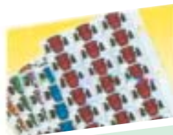
Les étiquettes alphabétiques

Il est également possible de vous proposer un système d'indexation basé sur le mois et le jour de naissance ainsi que tout autre système spécifique à votre organisation.